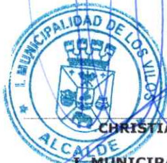
CHRISTIAN GROSS HIDALGO ALCALDE I. MUNICIPALIDAD DE LOS VILOS

DÉCIMA CUARTA: El presente convenio se firma en 1 ejemplar del mismo tenor y oficio, quedando copia digitalizada para ambas partes.